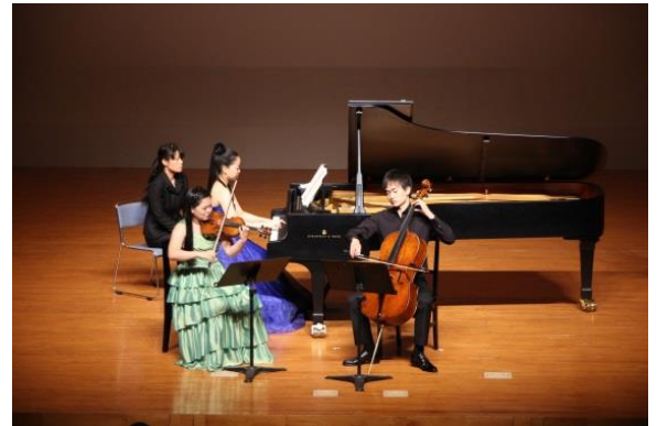
※平成 28 年度フレッシュアーティスト公演より