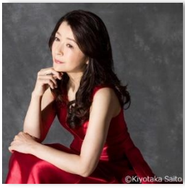
仲道 郁代 (ピアノ)