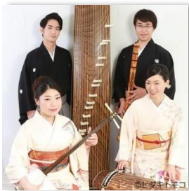
邦楽四重奏団 (箏、三絃、十七絃、尺八)