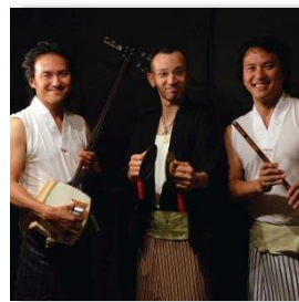
AUN & HIDE (和太鼓、津軽三味線、篠笛、鳴り物)