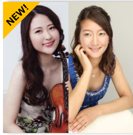
フレッシュアーティスト (ヴァイオリン、ピアノ)