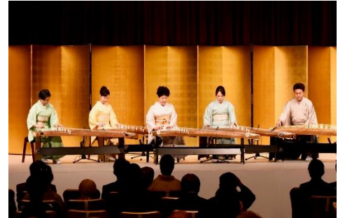
※Bプログラムは4名編成となります。