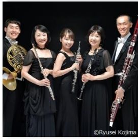
アミューズ・クインテット (木管五重奏)