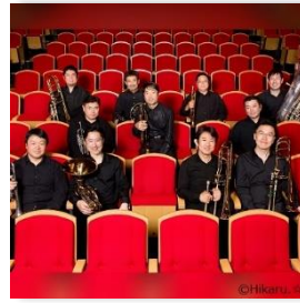
なぎさプラスソリスト (金管・打楽器アンサンブル)