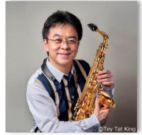
須川 展也 (サクソフォン)