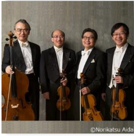
モルゴーア・クアルテット (弦楽四重奏)