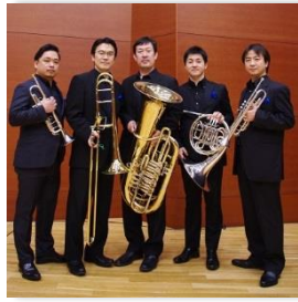
ザ・チェンバープラス (金管五重奏)