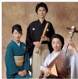
和ノ音 (琵琶、尺八、箏)