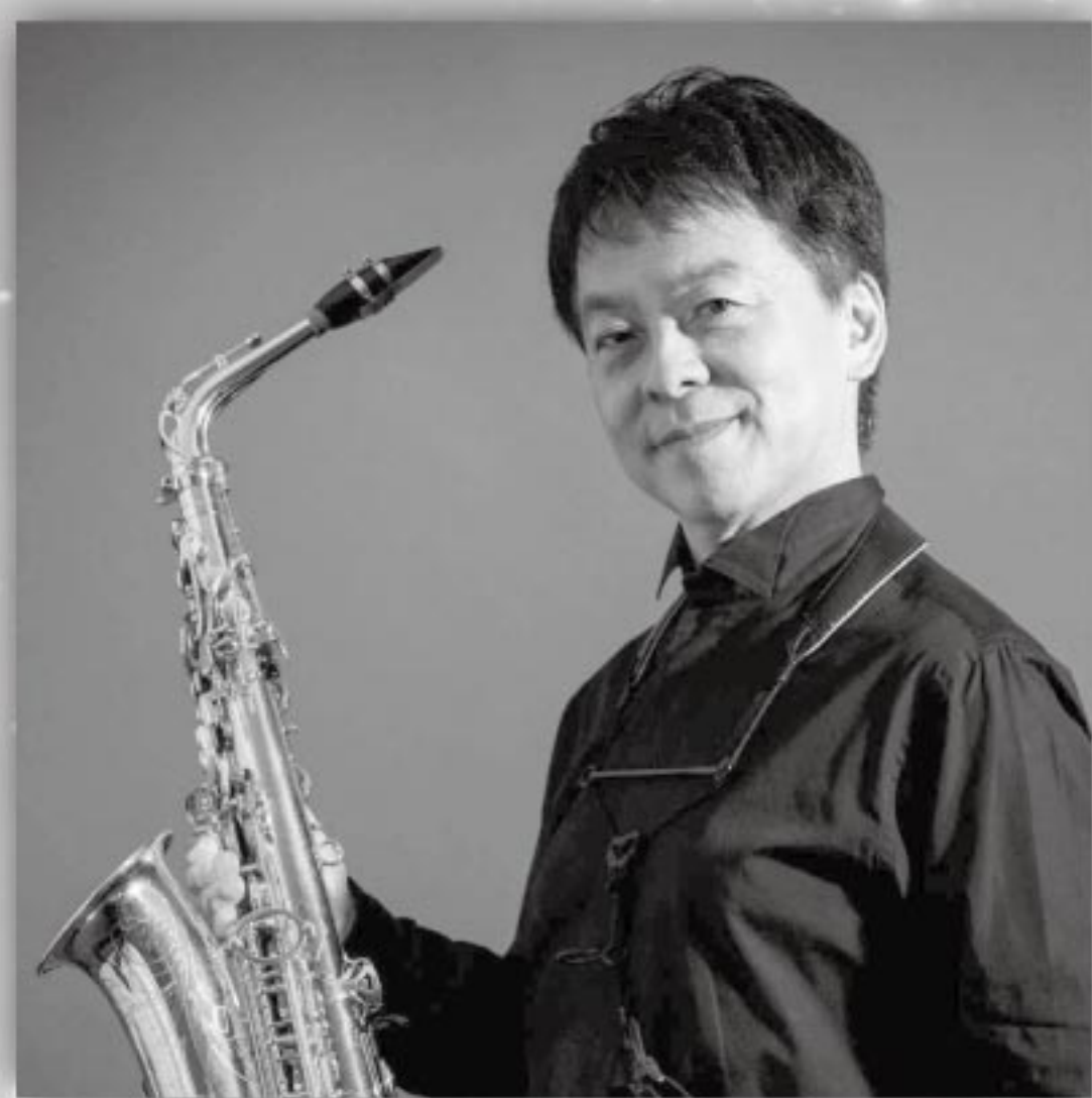
須川展也 (サクソフォン) Nobuya Sugawa, Saxophone

日本が世界に誇るクラシカル・サクソフォン奏者。長きにわたり、現代の名だたる作曲家への委嘱を継続。国際的に広まっている楽曲が多くあり、クラシカル・サクソフォンの領域への貢献は計り知れない。国内外の著名オーケストラと多数共演。ウィーンのムジークフェラインをはじめ30ヶ国以上で公演やマスタークラスを行う。東京藝術大学卒業。第51回日本音楽コンクール、第1回日本管打楽器コンクール最高位受賞。02年NHK連続テレビ小説「さくら」テーマ曲演奏。最新CDは自身初の無伴奏作品となる「バッハ・シークエンス」(令和2年度文化庁芸術祭レコード部門優秀賞受賞)。89-10年まで東京佼成ウインドオーケストラ・コンサートマスター、07-20年までヤマハ吹奏楽団常任指揮者を務める。トルヴェール・クワルテットのメンバー、東京藝大招聘教授、京都市立芸大客員教授。