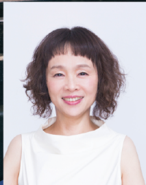
© Ayane Shindo ピアノ 小柳 美奈子