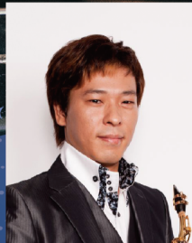
© Natsuki KAREN サクソフォン 山田 忠臣