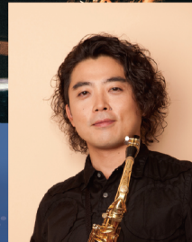
© Natsuki KAREN サクソフォン 福井 健太