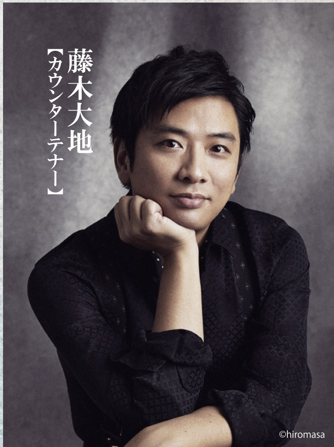
藤木大地 【カウンターテナー】